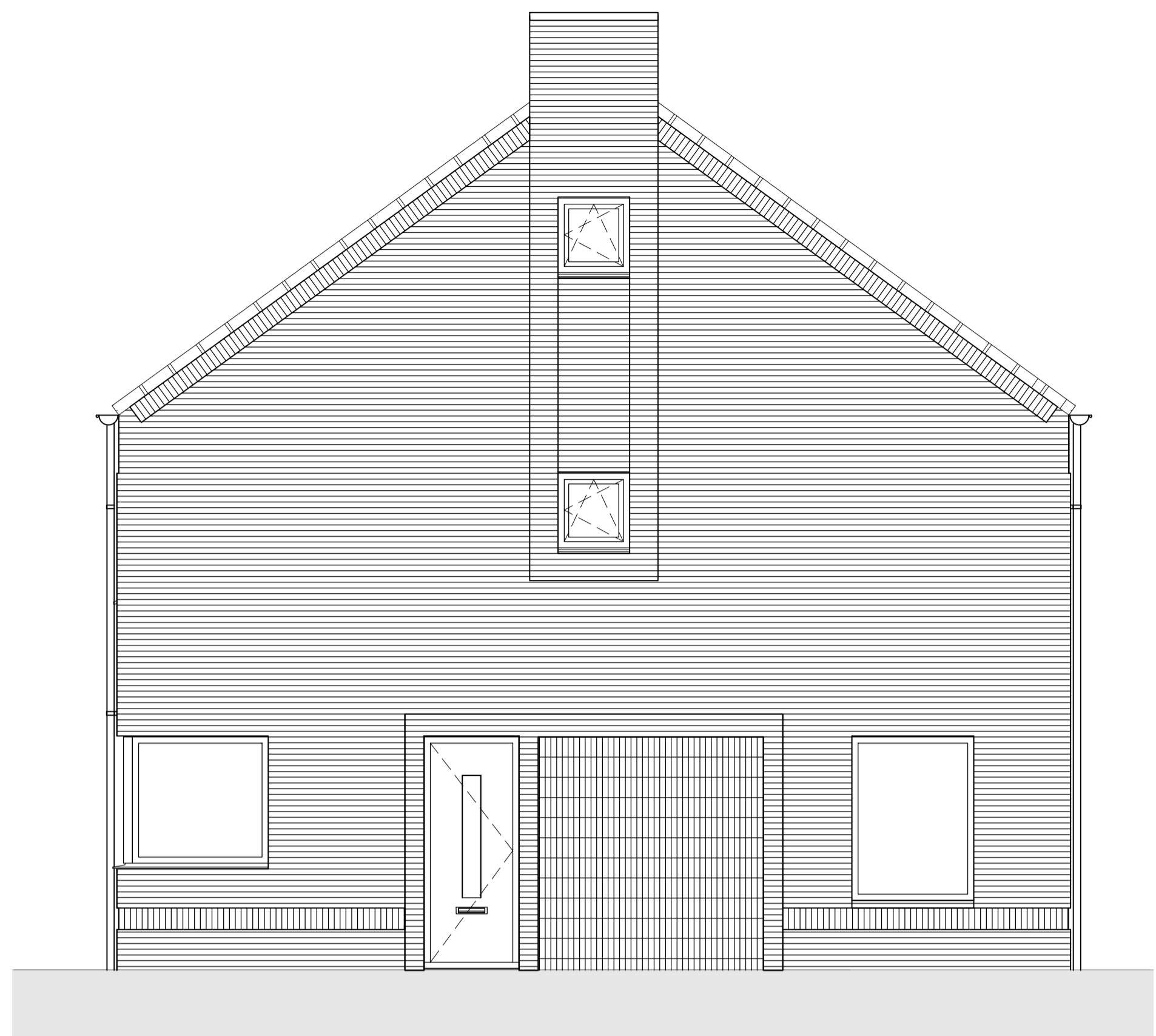
zigevel type GG