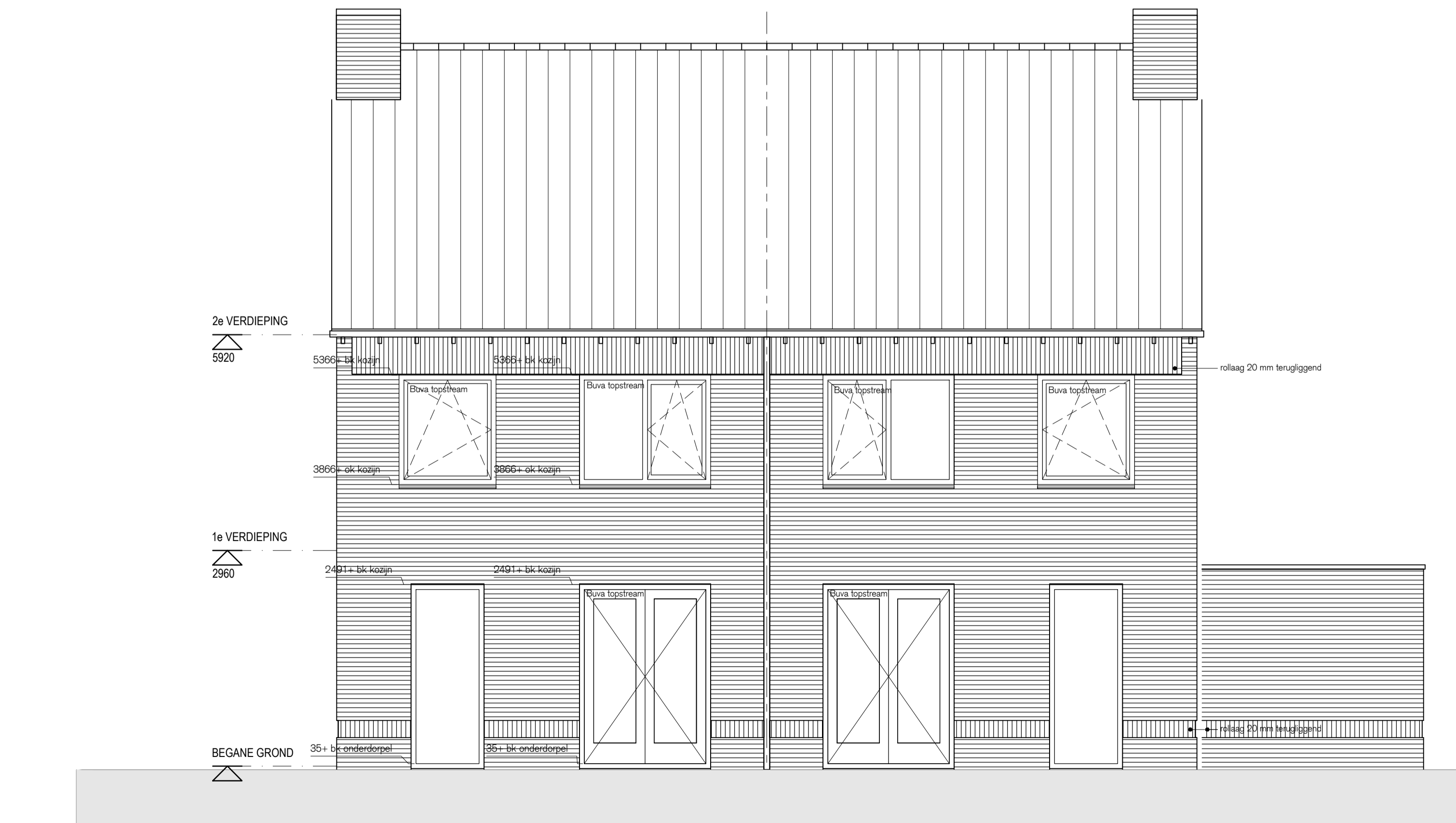
achtergevel type GG