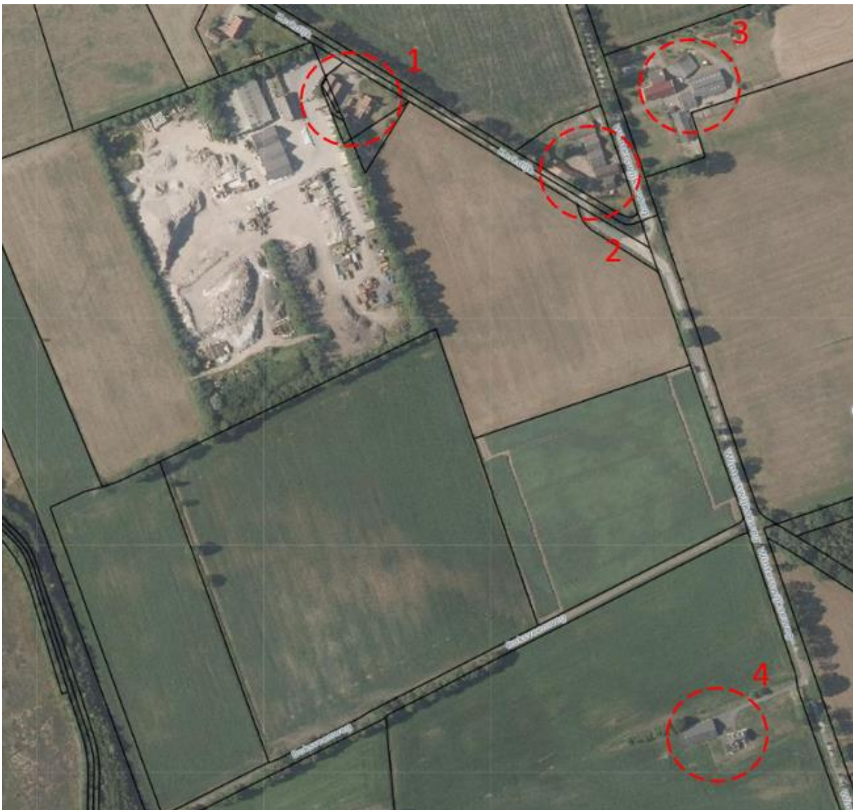
Figuur 1: direct omwonenden

Om persoonlijk kennis te maken en een toelichting te geven op het initiatief zijn de direct omwonenden binnen een contour van 250 m van het zonnepark als eerste persoonlijk op de hoogte gebracht van het initiatief (zie figuur 1). IX Zon is bij de betreffende adressen op bezoek geweest om persoonlijk kennis te maken en het initiatief toe te lichten. Ook zijn er afspraken gemaakt over het vervolgproces en zijn contactgegevens uitgewisseld. Kort daarna is er een klankbordsessie georganiseerd met de bewoners van voornoemde adressen, IX Zon en een landschapsontwerper om de belangrijkste zaken af te stemmen om te komen tot een eerste landschapsplan. Dit plan is vervolgens gedeeld met buurtbewoners in een bredere contour (zie volgend hoofdstuk).