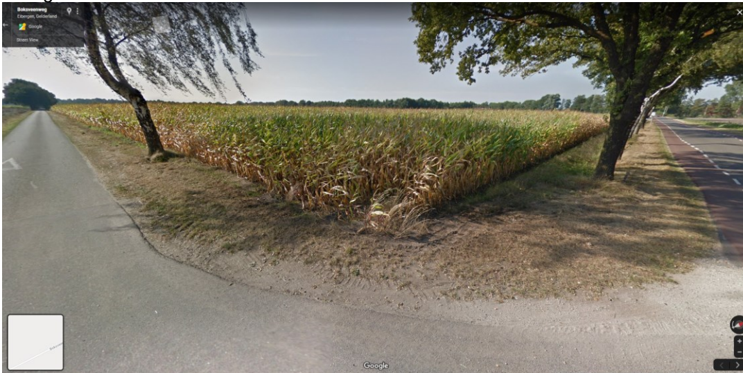
Zicht op de planlocatie vanaf de hoek Boksveenweg/Winterswijkseweg