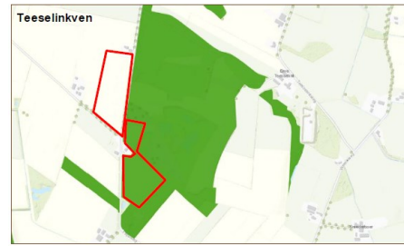
Uitsnede kaartbijlagen Omgevingsverordening Gelderland (niet op schaal)

Uit de kaarten bij de Omgevingsverordening Gelderland komt naar voren dat de percelen in het Noordijkerveld in het perceel naast Flipsweg 8 binnen het Gelders Natuurnetwerk (GNN) liggen. In het GNN is alleen ruimte voor nieuwe ontwikkelingen zolang deze de aanwezige en potentiële natuurwaarden niet aantasten. Volgens de 'Quickscan natuurtoets' die de aanvrager bij de ingediende aanvraag heeft gevoegd, is daarvan geen sprake. Het project past daarom binnen het provinciaal beleid voor de GNN.