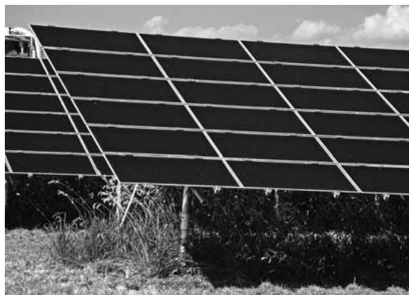
Abbildung 3 CdTe-Dünnschichtmodule

Bei Dünnschicht-Modulen wird im Gegensatz zu kristallinen Silizium-Modulen der Halbleiter als rund 2–10 \mu\text{m} dünne Schicht flächig auf ein geeignetes Trägermaterial (Glas, Metall oder Kunststoff) aufgebracht. Als Halbleiter sind amorphes oder mikrokristallines Silizium und Nicht-Silizium-Verbindungen , z. B. Cadmiumtellurid im Einsatz [2] [4].