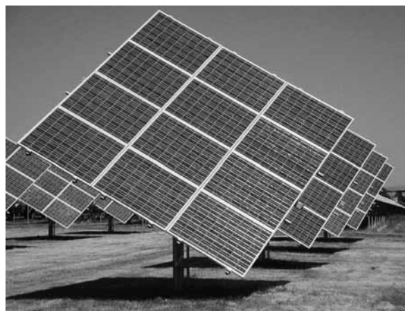
Abbildung 2 kristalline Silizium-Module

Kristalline Silizium-Module bestehen aus monokristallinem (c-Si) oder multi- bzw. polykristallinem Silizium (mc-Si bzw. pc-Si). Je nach Kristallaufbau weisen die Sili-