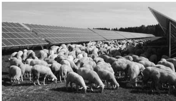
Abbildung 1 Solarpark Pocking mit Schafbeweidung [1]

Photovoltaik (PV)-Freiflächenanlagen sind in den letzten Jahren mancherorts wie Pilze aus dem Boden geschossen. Da die Freiflächenanlagen in der Regel nur mit 30 bis 40 % ihrer Fläche mit PV-Modulen bedeckt sind, kann sich zwischen den Reihen eine Grasnarbe ausbilden, die gemäht oder mit Schafen abgeweidet werden kann. Auch eine Freilandtierhaltung mit Geflügel, Rindern oder Pferden ist bei entsprechender technischer Anpassung, der Höhe der PV-Module und der Robustheit der Aufständungen möglich.