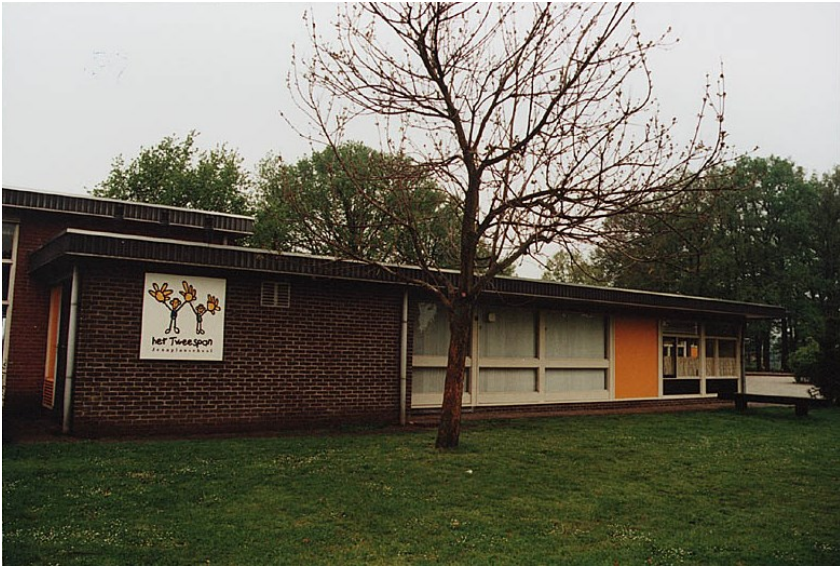
Figuur 5: huidige zijaanzicht vanaf de Haarstraat.