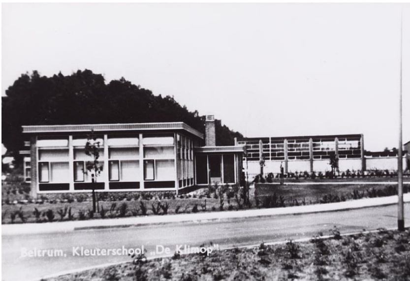
Figuur 3: aanzicht vanaf kruising , ca. 1973