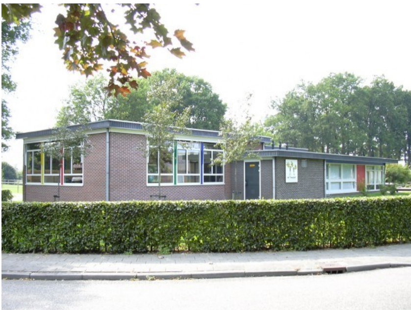
Figuur 4: huidige aanzicht