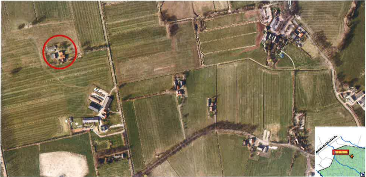
Afbeelding 1: Ligging perceel Schuppelijk7-9 Gelselaar (luchtfoto voorjaar 2016).

Bij de gemeente Berkelland is het verzoek binnengekomen om het bestemmingsplan voor het perceel Schuppelijk 7-9 in Gelselaar te wijzigen. Verzocht wordt om de geldende agrarische bestemming om te zetten in een woonbestemming.