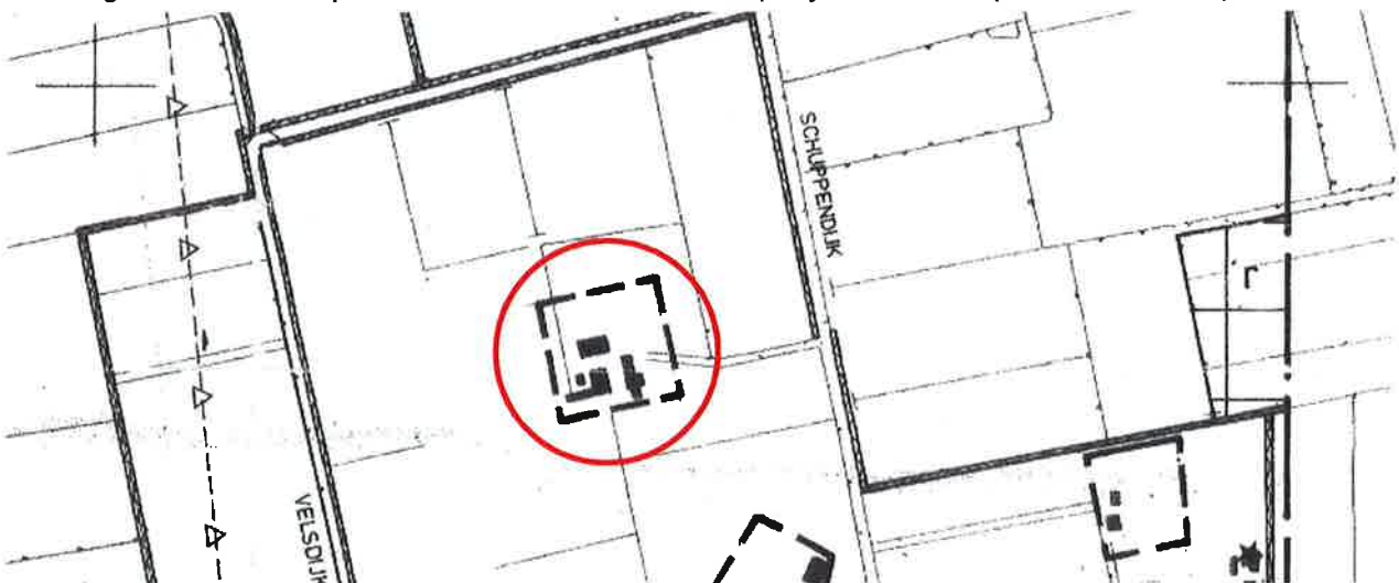
Afbeelding 2: plankaart bestemmingsplan "Buitengebied, integrale herziening" (Borculo).

Sinds de vernietiging van het bestemmingsplan "Buitengebied Berkelland 2012" op 27 augustus 2014 (ABRvS, nr. 201308008/1/R2), is voor het perceel Horstweg 6 het bestemmingsplan "Buitengebied, integrale herziening" weer van toepassing. De raad van de voormalige gemeente Borculo stelde dit bestemmingsplan vast op 24 juni 1993, waarna Gedeputeerde Staten van Gelderland het gedeeltelijk goedkeurden op 16 februari 1994. Het goedkeuringsbesluit werd onherroepelijk door de uitspraak van de Afdeling bestuursrechtspraak van de Raad van State op 7 januari 1997 (nr. E01.94.0086).