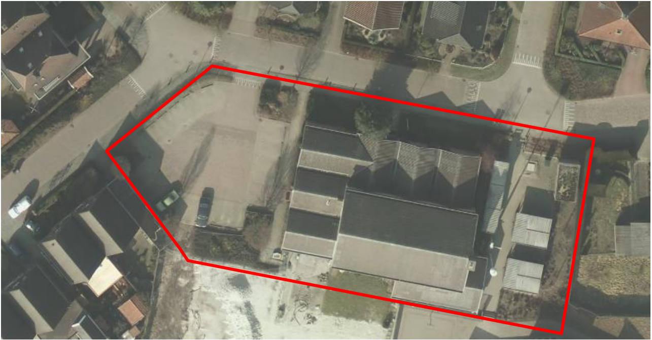
Afbeelding 1: luchtfoto bestaande situatie

Figuur met daarin het plangebied (foto's) en de kavelindeling