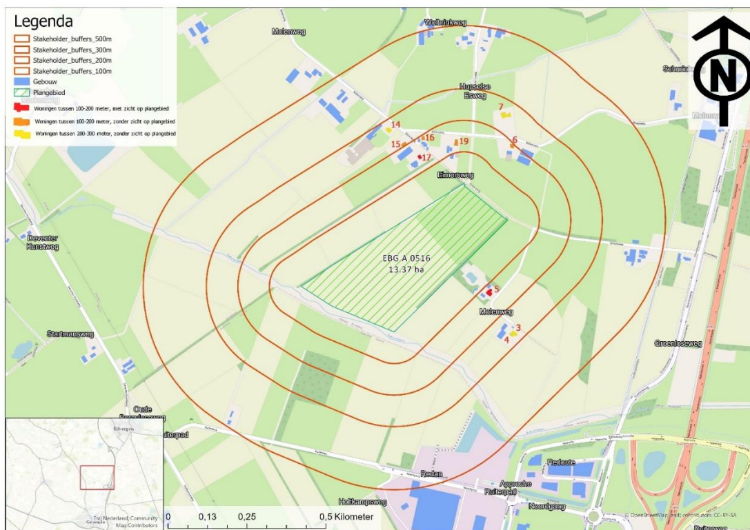
Figuur 1 Adressen binnen de binnen 300 meter contour van het projectgebied

Om persoonlijk kennis te maken en een toelichting te geven op het initiatief zijn de direct omwonenden als “goede buur” persoonlijk op de hoogte gebracht van het initiatief, hierbij is er gekozen voor een straal van 300 meter rondom het projectgebied (Figuur 1). Zicht op het zonnepark is hierbij als criterium gehanteerd, maar soms is de contour ook wat breder getrokken, bijvoorbeeld als mensen vlakbij elkaar in dezelfde straat wonen.