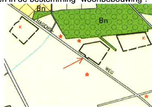
Uittreksel plankaart “Buitengebied” (Eibergen)

Het bestemmingsplan “Buitengebied” (Eibergen) kent aan het perceel Hagensweg 5 de bestemming “Agrarisch gebied”. Daarbij is het perceel voorzien van een agrarisch bouwvlak waarbinnen bebouwing mag worden gerealiseerd ten behoeve van het agrarisch bedrijf. Deze bestemming laat het voeren van een agrarisch bedrijf toe. Nu de agrarische bedrijvigheid ter plaatse is beëindigd, wordt verzocht om deze bestemming te wijzigen in de bestemming “woonbebouwing”.