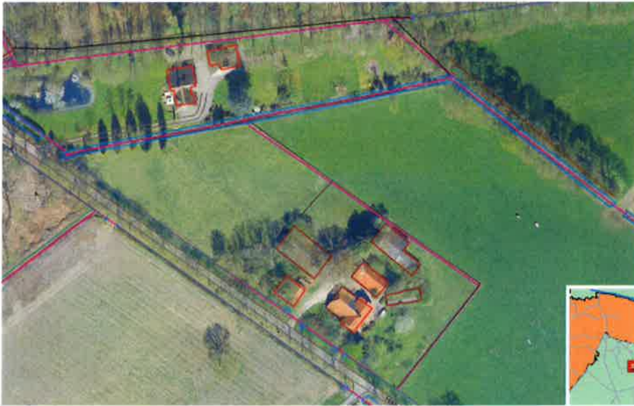
Luchtfoto (maart 2015)

Bij de gemeente Berkelland is het verzoek binnengekomen om het bestemmingsplan te wijzigen voor het perceel Hagensweg 5 in Eibergen. Verzocht wordt om de agrarische bestemming te wijzigen in een woonbestemming.