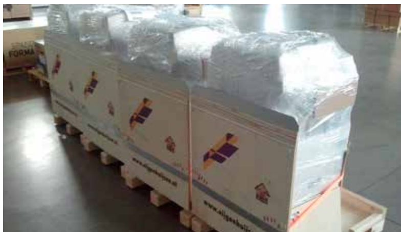
Klaar voor transport op de innovatieve pallets