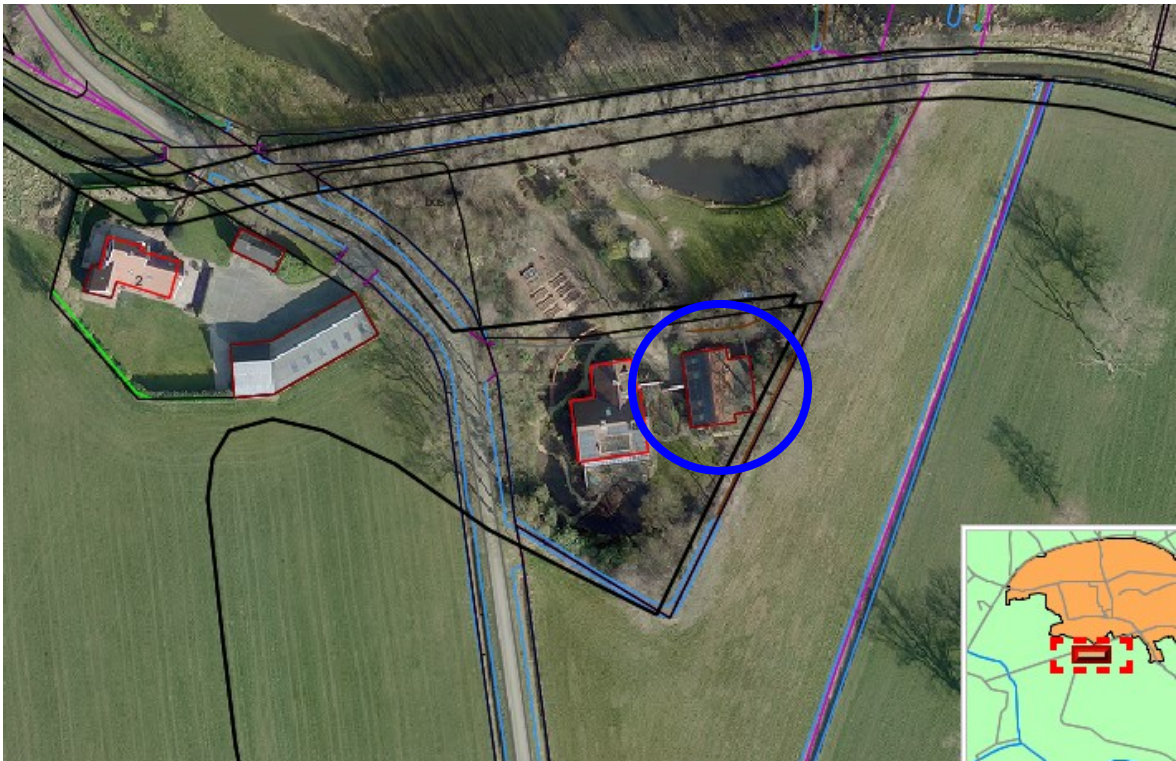
Luchtfoto Hoonteweg 1a met bijgebouw (maart 2014, niet op schaal)