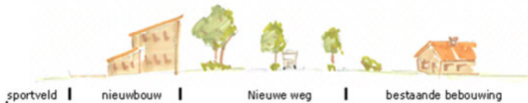
Afbeelding 2: Dwarsprofiel bouwperceel 1 ten opzichte van bestaande bebouwing