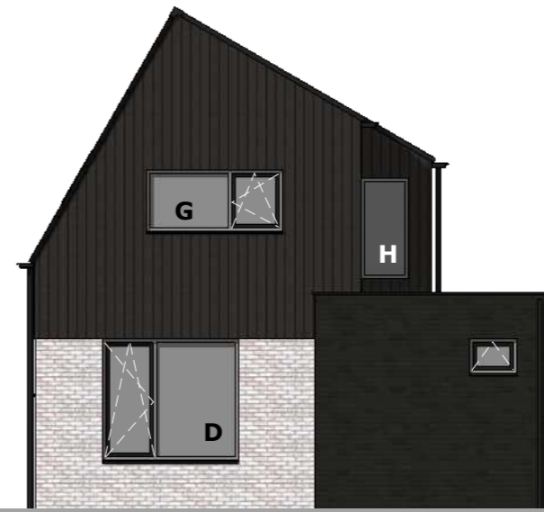
B VOORGEVEL / Zuid-West