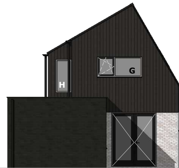
D ACHTERGEVEL / Noord-Oost

Het rapport "Toetsing BouwBesluit" is onlosmakelijk van toepassing.