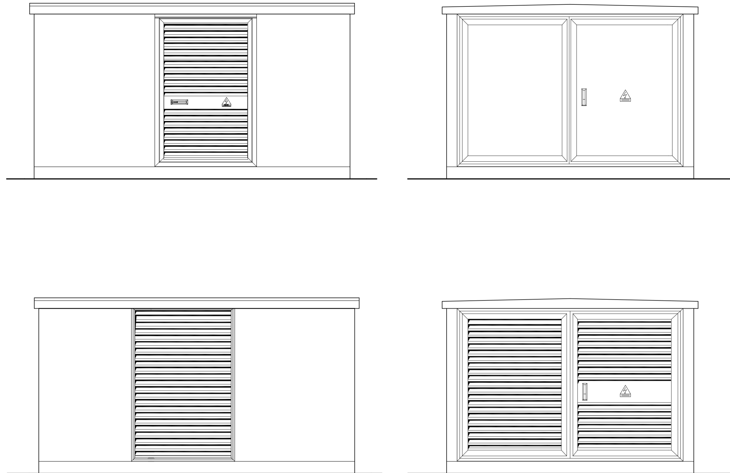
views sc. 1:50