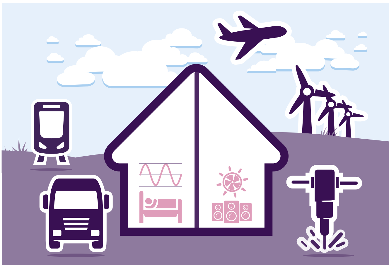
Figuur 2. LFG-bronnen in en om het huis (oorspronkelijke bron: Baliatsas en anderen, 2016)