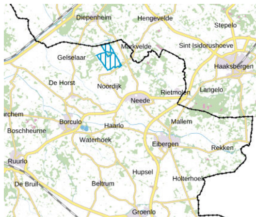
Omgevingsverordening Gelderland (Geconsolideerde versie februari 2022, plankaart Natuur-3)

Hiermee leidt de gewijzigde vaststelling van het bestemmingsplan “Buitengebied Berkelland 2020” ertoe dat het in de Omgevingsverordening aangewezen weidevogelgebied wordt verwerkt in het nieuwe bestemmingsplan. Omdat de geldende bestemmingsplannen geen planologische regeling kennen voor weidevogelgebieden, is er geen sprake van het wegbestemmen van weidevogelgebieden. Verder worden flora en fauna ook buiten het weidevogelgebied beschermd door de algemeen geldende wettelijke onderzoekplichten bij ruimtelijke ontwikkelingen en door de randvoorwaarden die het nieuwe bestemmingsplan bijvoorbeeld stelt aan het toepassen van afwijkings- of wijzigingsregels. Daarnaast wordt ook de ecologische hoofdstructuur verwerkt op zowel de verbeelding als in de planregels van het nieuwe bestemmingsplan, iets wat in de geldende bestemmingsplannen overigens niet het geval is en waarvan ook een beschermende werking uitgaat. Verder laten de agrarische gebiedsbestemmingen in het nieuwe bestemmingsplan ook toe dat daarbinnen weidevogelbeheer plaatsvindt. Het is daarom ook niet nodig om de gebieden die volgens de huidige Omgevingsverordening niet langer zijn aangemerkt als weidevogelgebied wel als zodanig aan te duiden in het nieuwe bestemmingsplan. Dat onderdeel van de zienswijzen wordt dan ook niet overgenomen.