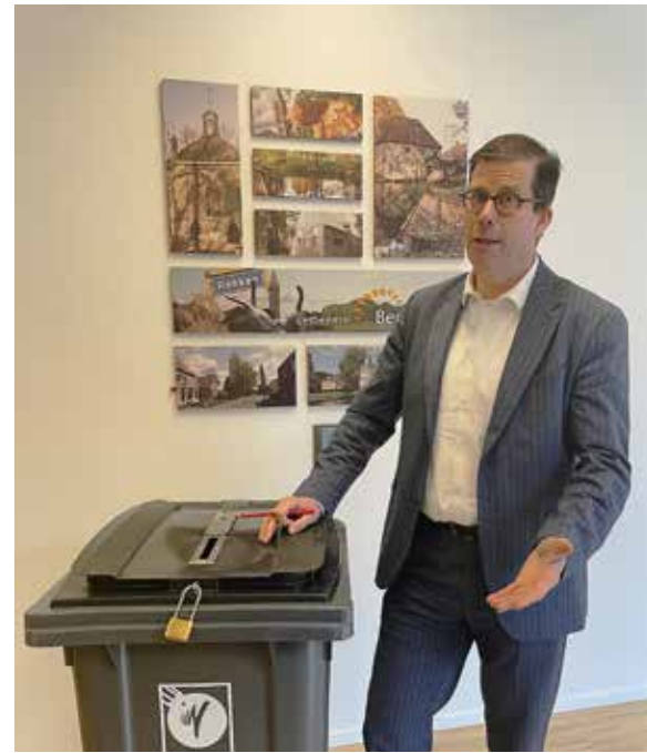
Laat uw stem niet verloren gaan.